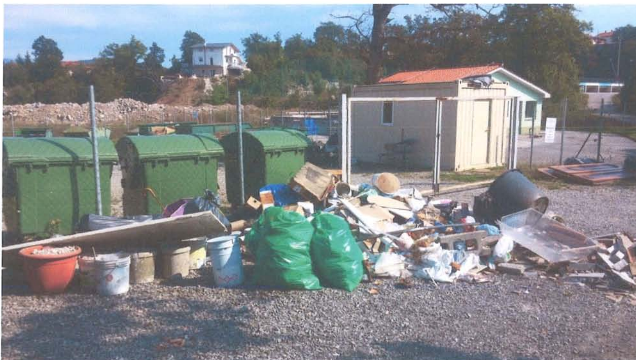
Nepravilno odloženi odpadki pred zbirnim centrom v Divači

Kontrole smo izvajali tudi na ekoloških otokih, saj smo opazili, da se jih v veliki meri poslužujejo tudi poslovni subjekti, za odlaganje odpadkov iz svoje dejavnosti, čemur pa ekološki otok ni namenjen. Nepravilno odloženi odpadki so se pojavljali tudi pred vhodom v zbirni center za individualni dovoz odpadkov.