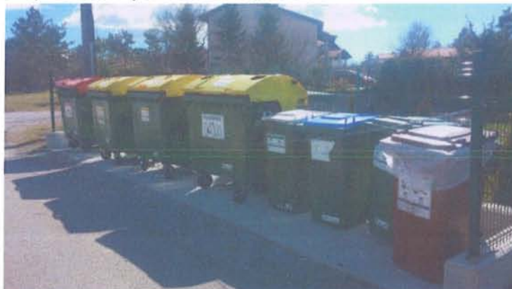
ekološki otok v Ležečah

Na ekoloških otokih je postavljenih najmanj 6 zabojnikov za ločeno zbiranje papirja, plastenk, plastične embalaže, steklene embalaže, pločevink in bio odpadkov. Veliko otokov je opremljenih z več zabojniki za isto vrsto odpadkov. Zabojniki se praznijo najmanj 1x tedensko, nekateri pa tudi 2x tedensko.